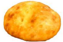
塩フォカッチャ (180円)