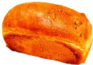
ミニくるみ食パン (400円)