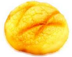
ブリオッシュ メロンパン (250円)