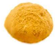
こしあんきなこ (250円)