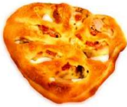
ベーコンとチーズ のフーガス (280円)