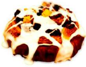
シナモンロール (280円)