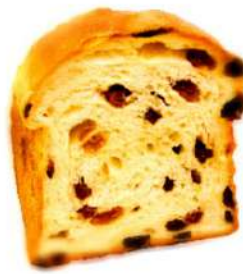
レーズン食パン (800円)