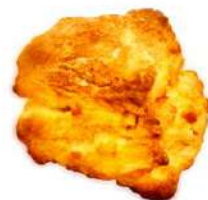
オレンジのスコーン (250円)