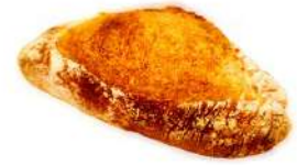
全粒粉のバゲット (230円)