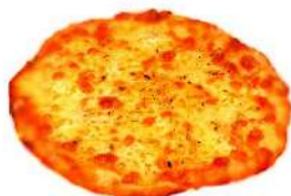
5種チーズの タルトフランベ (250円)

クリスピーな生地に5種 類のフレッシュチーズを のせて高温でカリッと焼 き上げました。