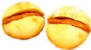
みるくぱん ピーナッツクリーム (2個入 230円)