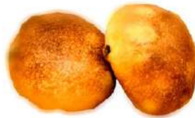
レーズンパン (2個入 180円)