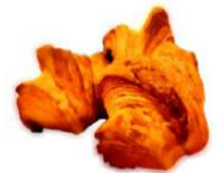
ミニチョコ クロワッサン (3個入 240円)