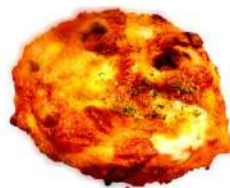
チーズカレーパン (280円)