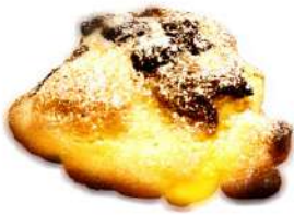
ダイヤモンド・ショコラ (240円)