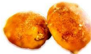
くるみぱん (2個入 180円)