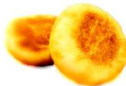
イングリッシュ マフィン (2個入 200円)

クリスピーな生地に5種 類のフレッシュチーズを のせて高温でカリッと焼 き上げました。