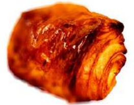
パンオショコラ (280円)