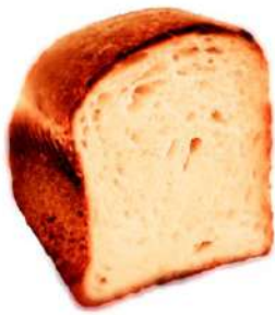
食パン (ハーフ 290円)