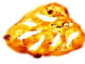
塩カシューナッツの フーガス (280円)