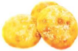
みるくぱん (3個入 160円)