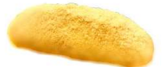
あげぱんきなこ (230円)