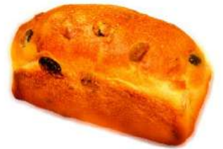
ミニレーズン食パン (400円)