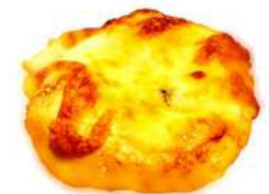
チーズフォカッチャ (230円)