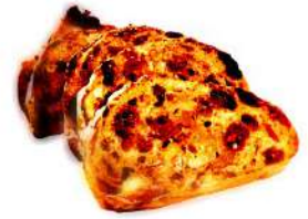
ドライフルーツのパン (450円)