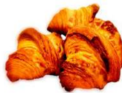
ミニクロワッサン (3個入 180円)