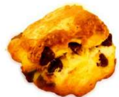
チョコのスコーン (250円)