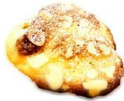
クロワッサン・ダイヤモンド (210円)