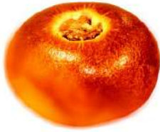
ブリオッシュ あんぱん (250円)