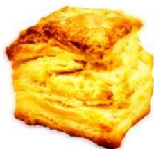
プレーンスコーン (200円)